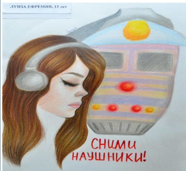
ЛУИЗА ЕФРЕМЯН, 13 лет

В ожидании поезда не бегайте по платформе, не играй на ней, не катайся на велосипеде, роликах и т.д. Железная дорога- зона повышенной опасности, а не место для игр!