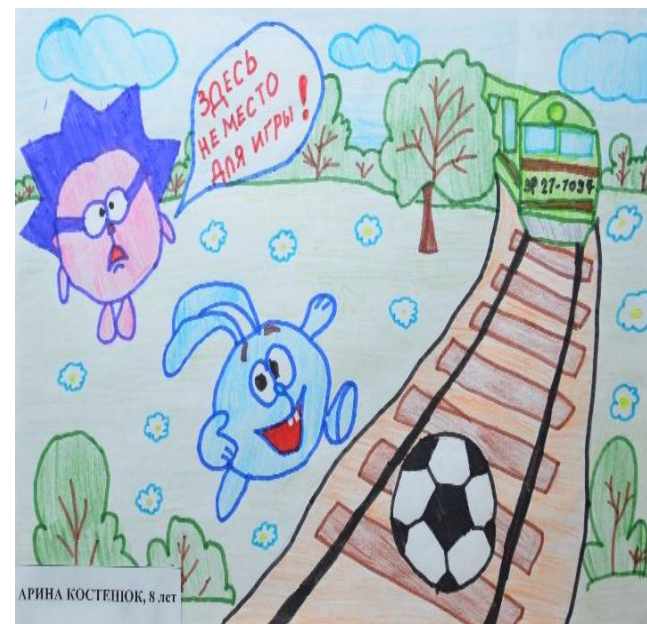
АРИНА КОСТЕШОК, 8 лет